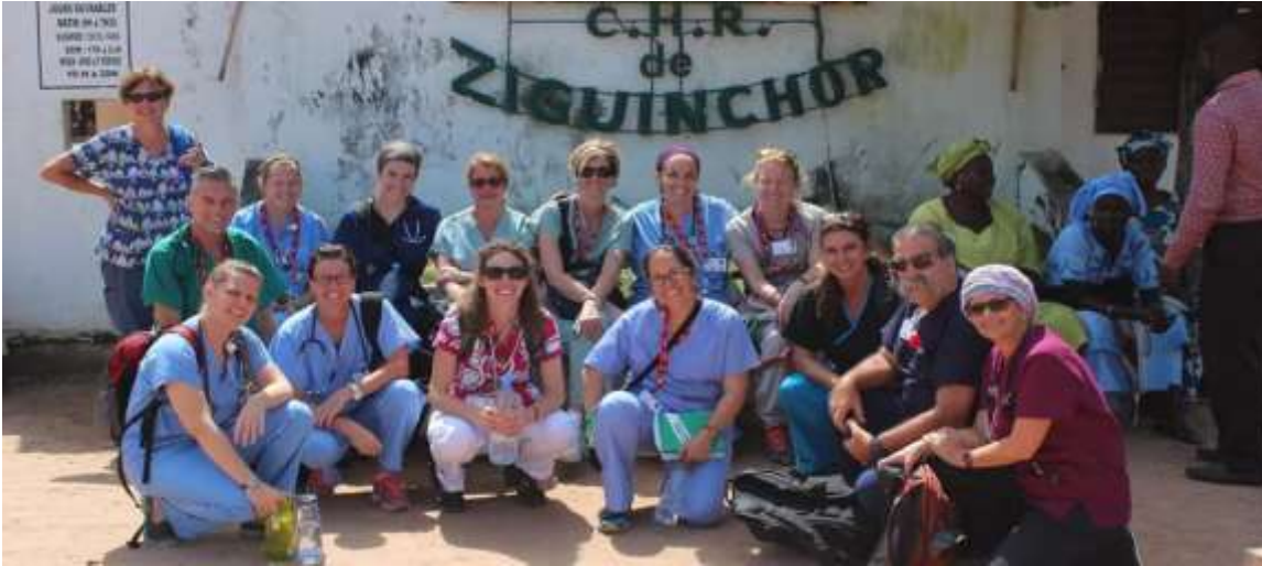
Les étudiants de l'UQAT - Santé mondiale devant l'hôpital régional de Ziguinchor