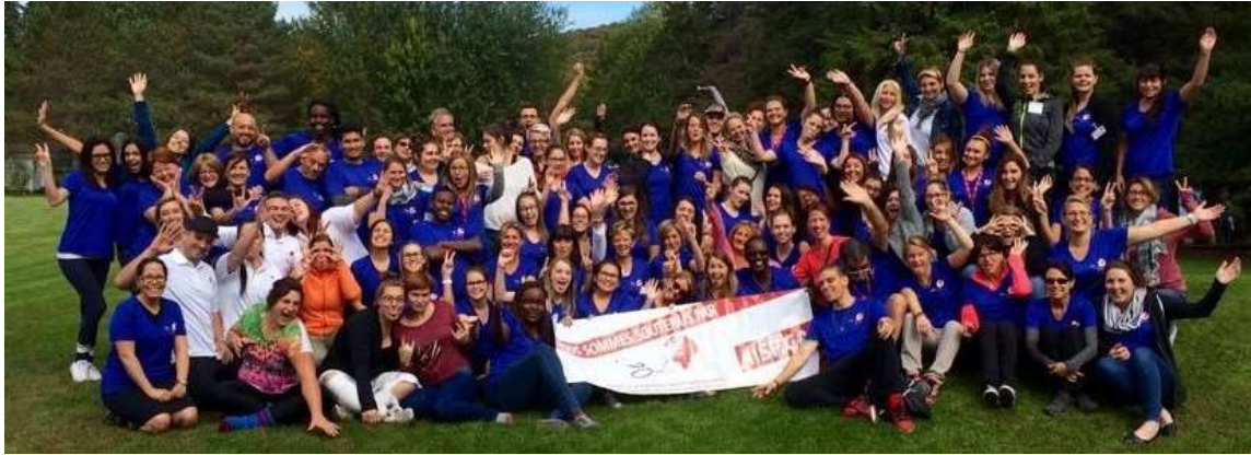
Les groupes soutenus par IISF 2015-2016

milieux cliniques, les pathologies fréquemment rencontrées, la compétence culturelle, le choc culturel et ont participé à un atelier sur les points de suture.