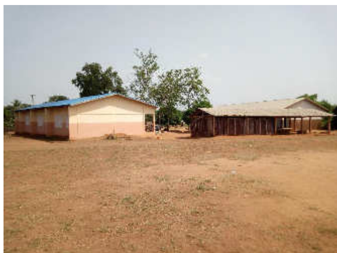
Module de classe réfectionné dans le village Hayakpa