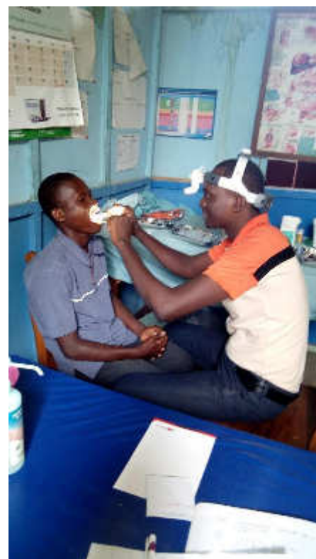
Mission ORL à cococodji