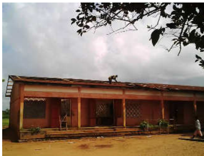
Ecole Primaire Publique de Zounme, Novembre 2018