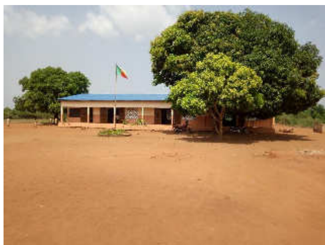
Ecole Primaire Publique de Zounme, Décembre 2018