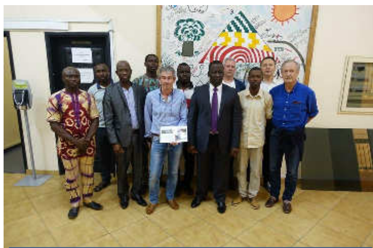
Audience avec le Ministre de la Santé, Avril 2018