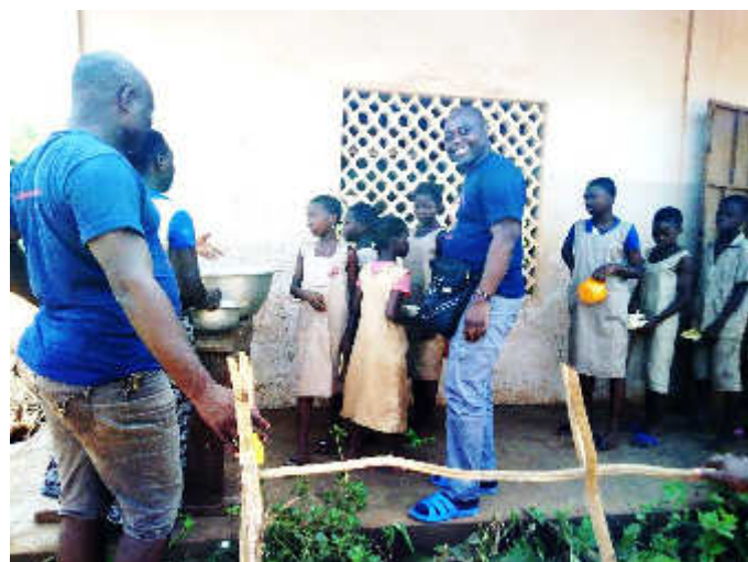
Mission d'évaluation du représentant I Bambini dell'Africa ONLUS