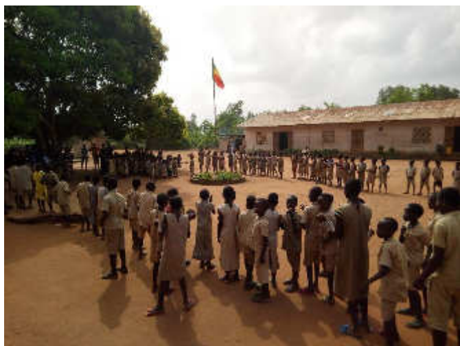
Accueil des écoliers de Zounme pour la délégation italienne