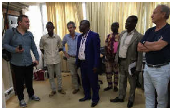
Audience avec le Secrétaire Générale du Ministère du plan