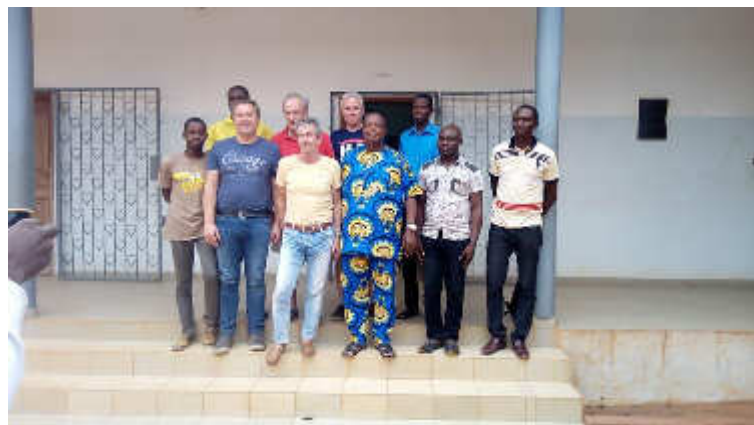
Audience avec le Maire de Djakotomey