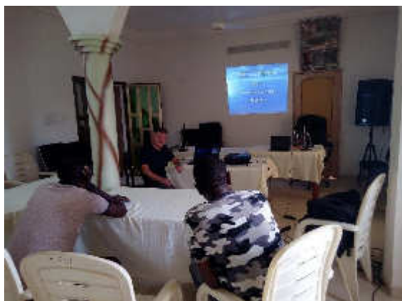
Formation des médecins