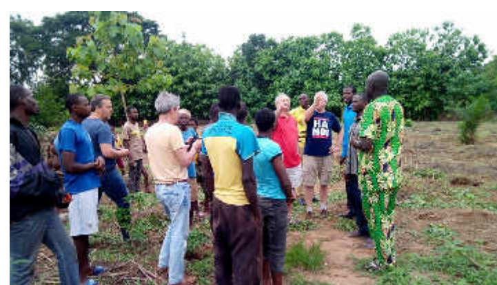
Visite dans le village GOLAMEY/Djakotomey