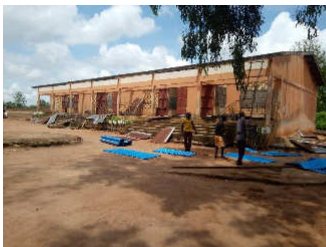
Démarrage des travaux de réfection