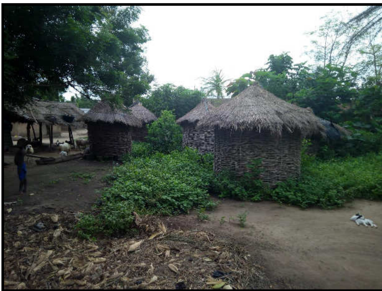
Village HOUNHOMÉY, Commune de Djakotomey, Octobre 2018