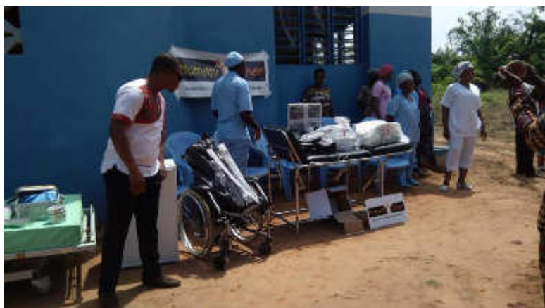
Remise des dons à l'hôpital de Kodji

Le projet ayant permis de remettre quelques kits scolaires à des écoles en besoin et du matériel médical à l'hôpital de Kodji dans la commune de Dogbo a ainsi pris fin. L'ONG La Fraîche Rosée a reçu une table de consultation ainsi qu'une imprimante multifonction afin d'appuyer l'administration.