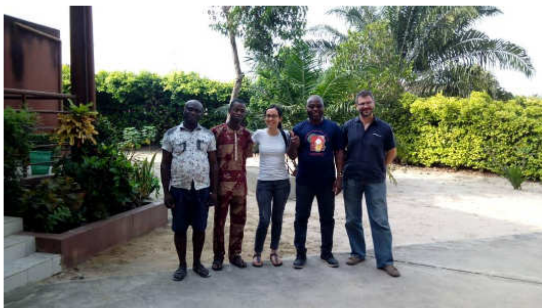
Réunion conjointe Fraiche Rosée/ I Bambini dell'Africa ONLUS et A.MI.CO