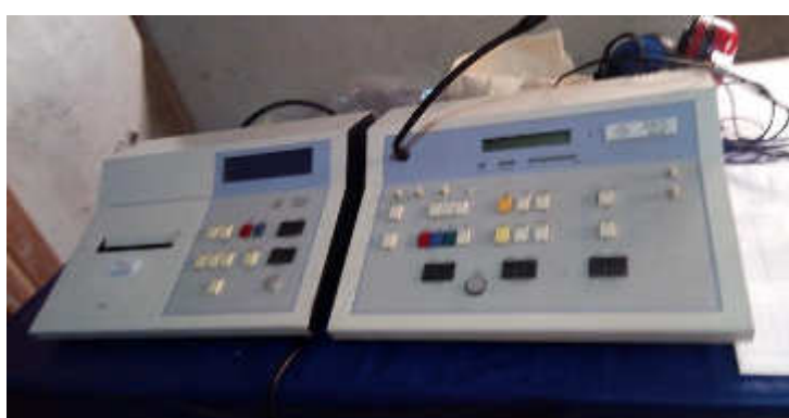
Matériel ORL Reçu de l'association ORL-SF