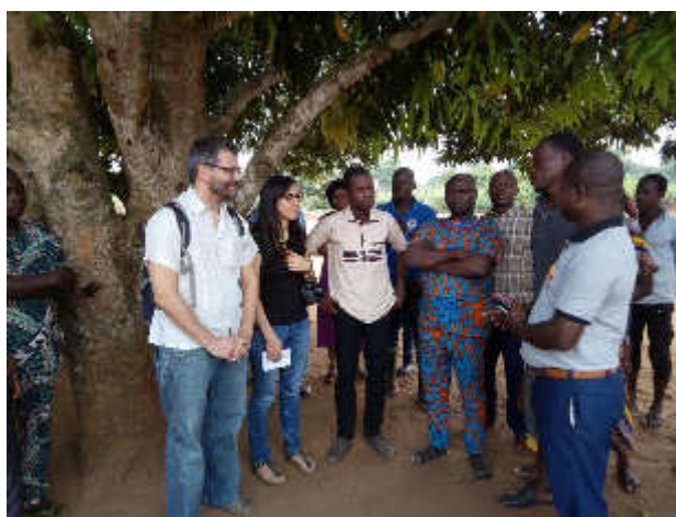
Mission d'évaluation des représentants AMICO Awards