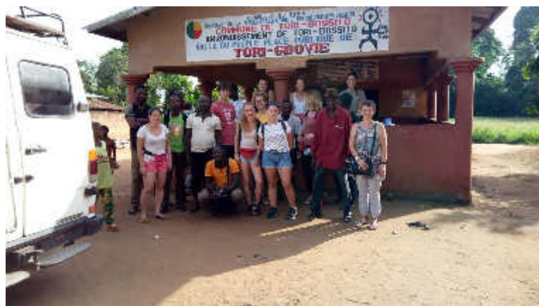
Gbovié Juillet 2018