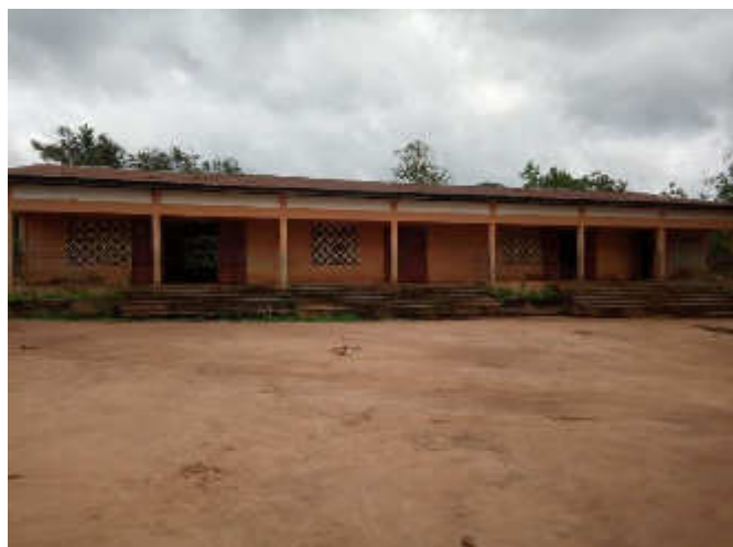
Ecole Primaire Publique de HAYAKPA, Octobre 2018