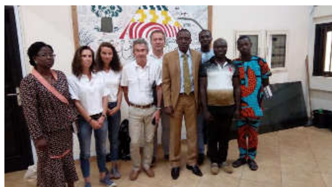
Rencontre avec le Directeur de Cabinet du nouveau Ministre de la Santé, Juillet 2018