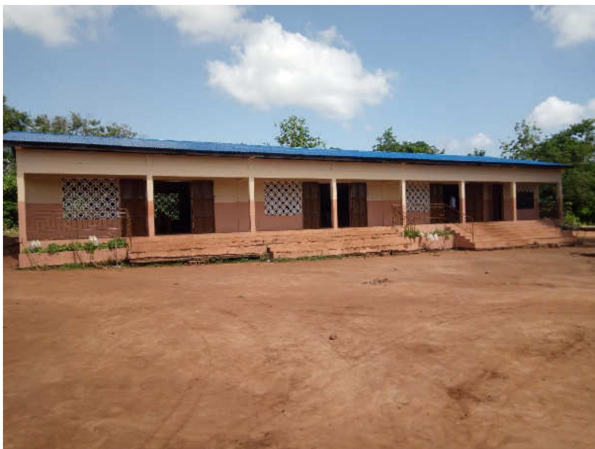
Ecole primaire publique de HAYAKPA réfectionnée par ONG La Fraîche Rosée et I Bambini Dell'Africa ONLUS sous financement AMICO Awards 2018