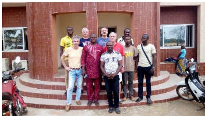
Audience avec le Maire de Dogbo