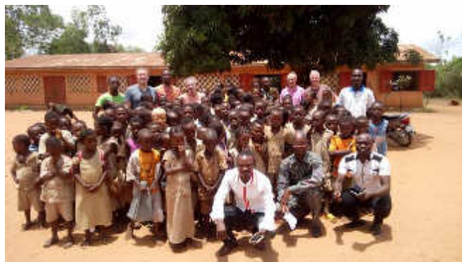
Visites dans des écoles de Tori-Bossito