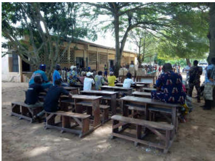
Remise des dons dans les écoles