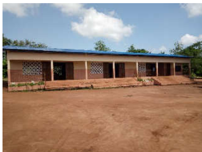
Ecole Primaire Publique de Hayakpa, Décembre 2018