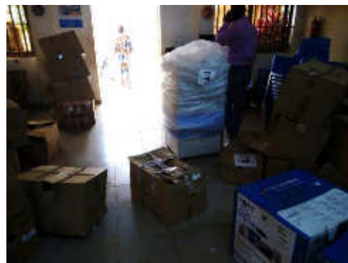
Dons destinés aux écoles et Mairie de Tori-Bossito