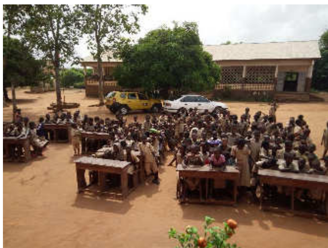
Accueil des écoliers de Zounme pour la délégation italienne