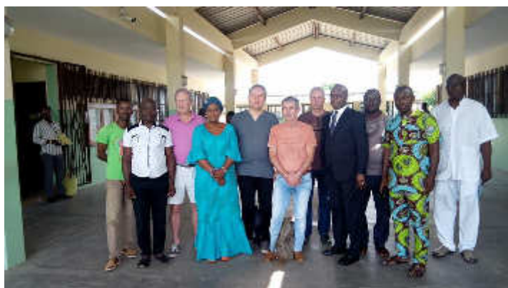
Séance de travail avec le Directeur du CNHU