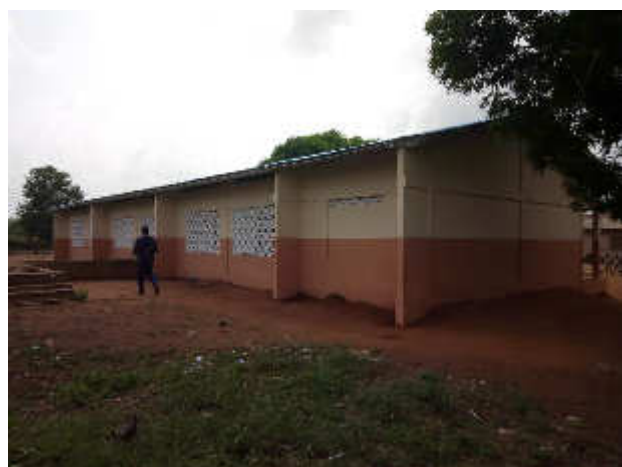
Module de classe rénové dans le village Zounme