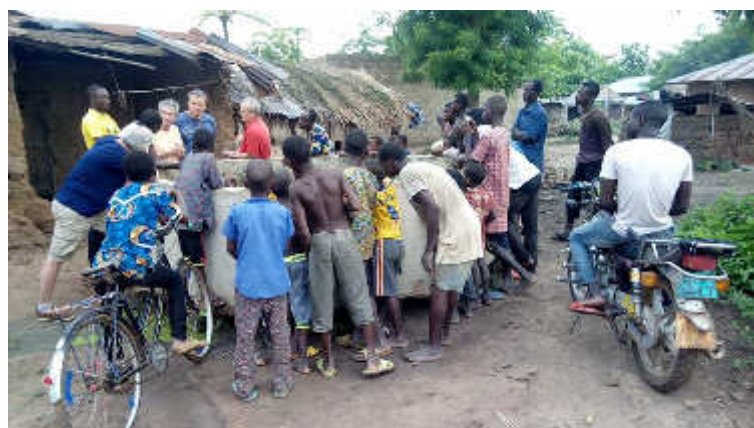
Visite dans le village HOUNHOUMEY/Djakotomey