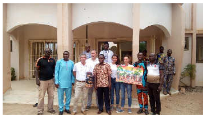
Rencontre avec le Maire de Tori-Bossito