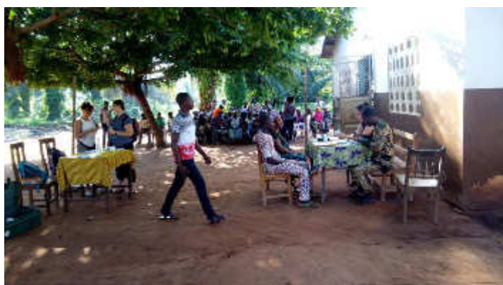
Ce fût la plus belle expérience 2018