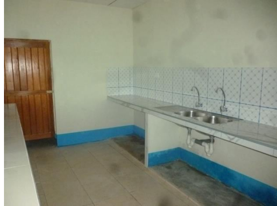
La cuisine du CPVC avant (gauche) et après (droite) la réfection.