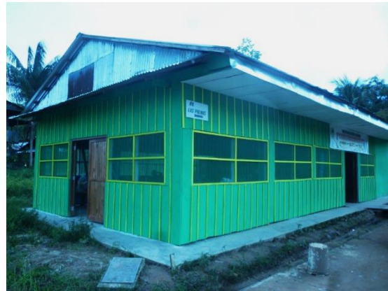
Le CPVC avant (gauche) et après (droite) la réfection.

Les travaux entrepris consistaient donc à bonifier les installations du CPVC en y ajoutant une cuisinette fonctionnelle, une salle de bain complète (avec toilette et douche), une sortie d'urgence et une réserve d'eau supplémentaire, le rendant ainsi plus propice à l'hébergement de groupes.