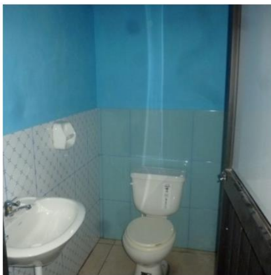
Le CPVC est désormais équipé de tables, de chaises et d'une salle de bain complète.