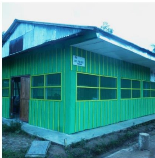
Le CPVC avant (gauche) et après (droite) la réfection.