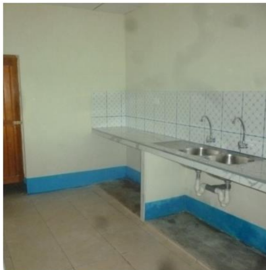
La cuisine du CPVC avant (gauche) et après (droite) la réfection.