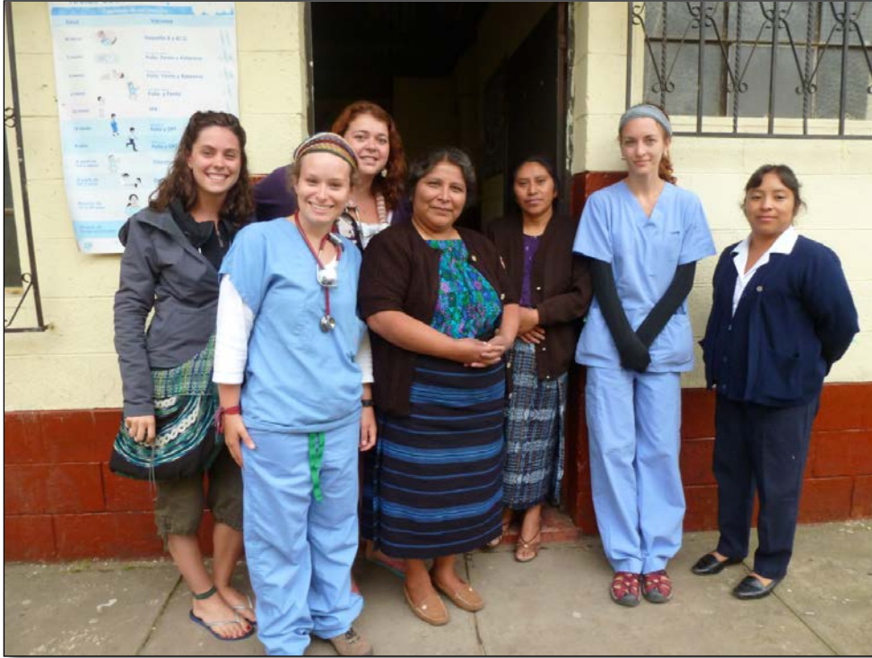
Devant le Puesto de Salud de Santa Maria de Jesus